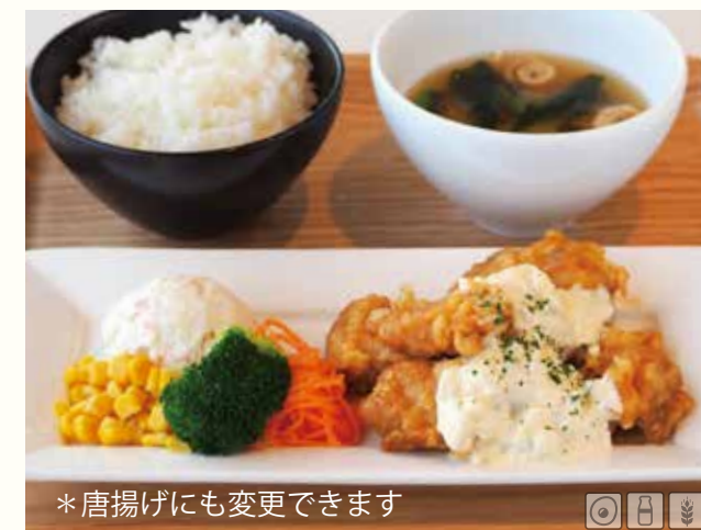
チキン南蛮ランチ ¥1580 さっぱりとしたソースでごはんが進みます