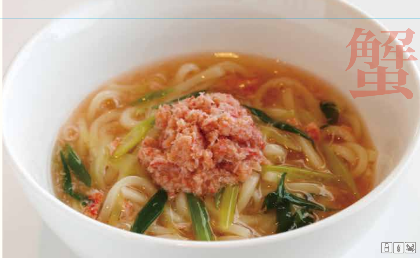
かに 蟹あんかけうどん ¥1380