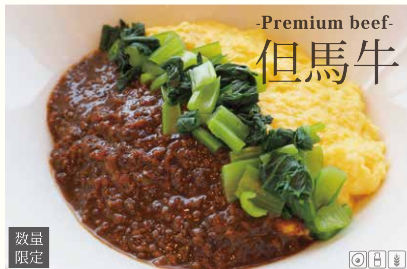
但馬牛そぼろあんかけ卵丼 ¥1450 コクのあるそぼろとふんわり卵が相性抜群！