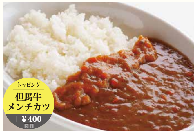
トッピング 但馬牛 メンチカツ + ¥400 甘口カレー ¥1100 *アレルギー対応