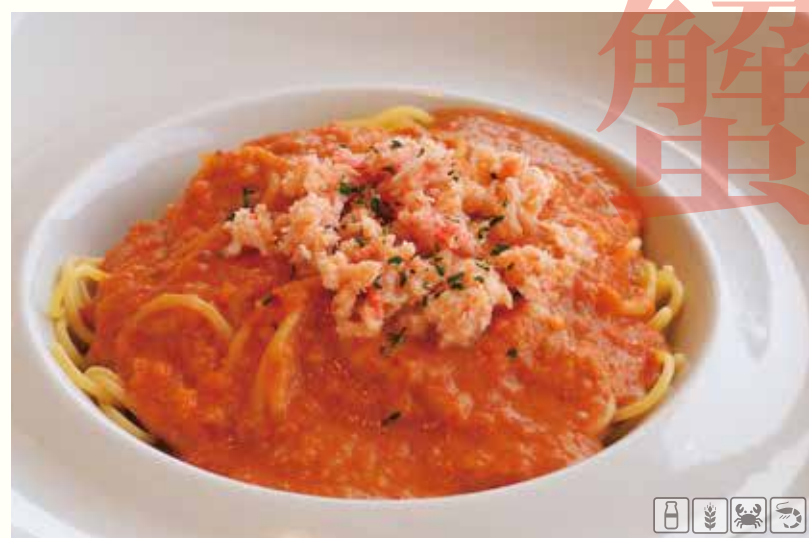
蟹トマトクリームパスタ ¥1480