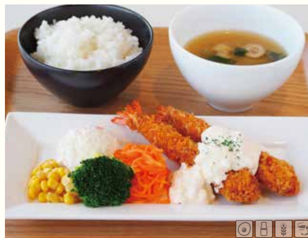
エビフライランチ ¥1430 定番のエビフライランチ