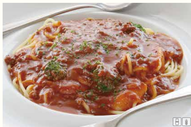
但馬牛ミートパスタ ¥1580