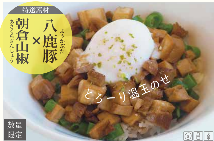
八鹿豚チャーシュー丼 ¥1650 朝倉山椒の香りが食欲を引き立てます。