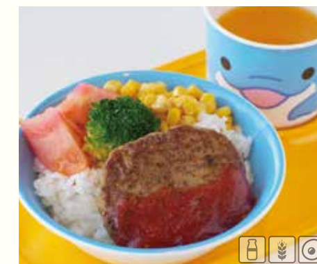
お子様ハンバーグ ¥780