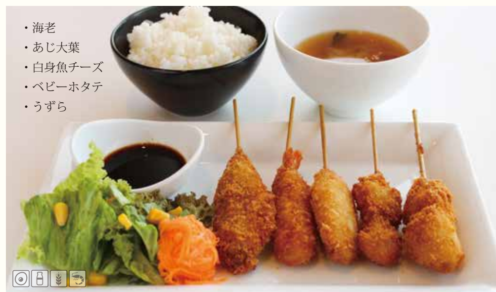
人気のランチセット 海鮮串揚げランチ ¥1480