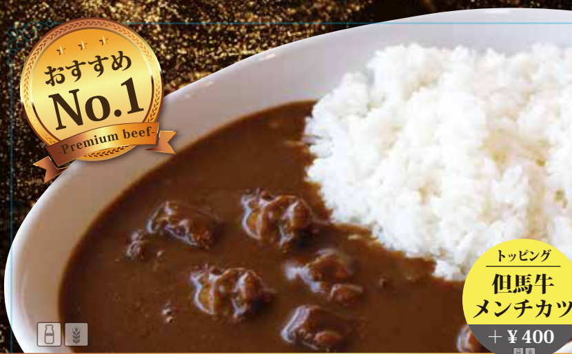
たじまうし 但馬牛100%プレミアム ¥1800 ビーフカレー ごろっと入った但馬牛で豊かな風味をご堪能ください。