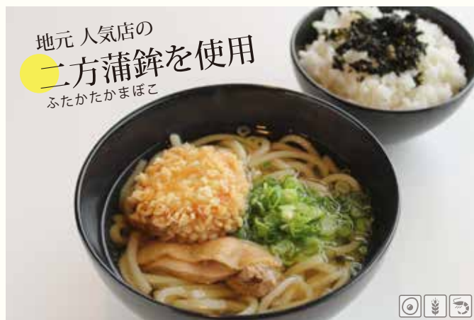
地元 人気店の 二方蒲鉾を使用 ふたかたかまぼこ エビまる天うどん & しそわかめ御飯 ¥1280 (エビまる天うどん 単品 ¥1180)