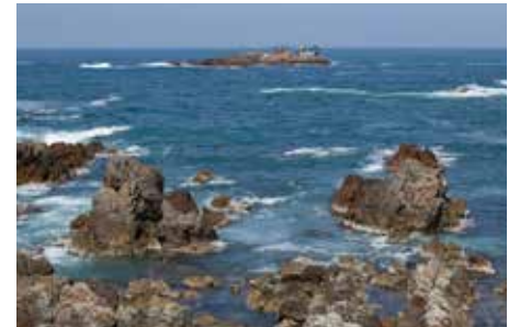
日和山海岸とシンボルの「龍宮城」