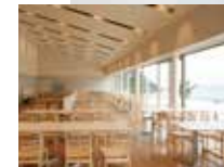
海と山のお昼ごはん — 但馬牛 — 税込 2,530 円