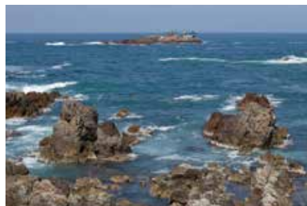
日和山海岸とシンボルの「龍宮城」