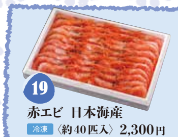
19 赤エビ 日本海産 冷凍 〈約40匹入〉 2,300円