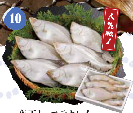
10 一夜干し エテカレイ 冷凍 〈500g入〉 1,200円