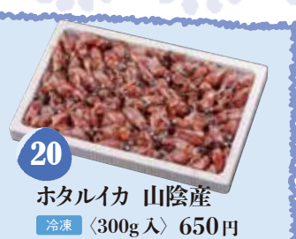
20 ホタルイカ 山陰産 冷凍 〈300g入〉 650円