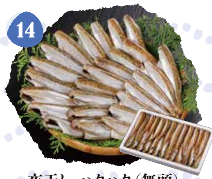
14 一夜干し ハタハタ(無頭) 冷凍 〈400g入〉 850円