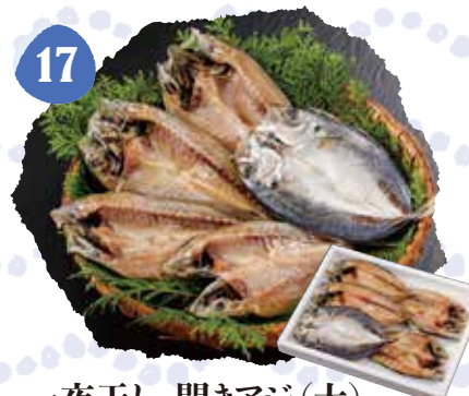
17 一夜干し 開きアジ(大) 冷凍 〈TS〉 1,000円