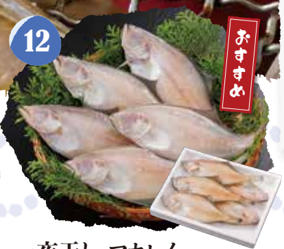
12 一夜干し マカレイ 冷凍 〈500g入〉 1,200円