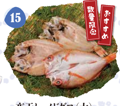
15 一夜干し ノドグロ(大) 冷凍 〈1匹/16~18cm〉 1,000円