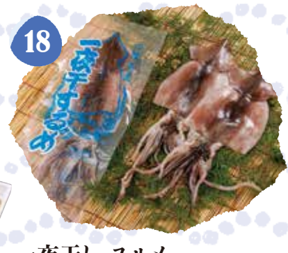
18 一夜干し スルメ 冷凍 〈2枚入〉 950円