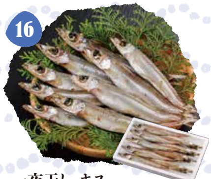
16 一夜干し キス 冷凍 〈300g入〉 550円