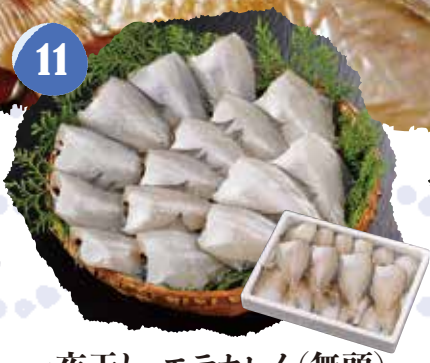
11 一夜干し エテカレイ(無頭) 冷凍 〈500g入〉 1,200円