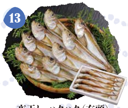
13 一夜干し ハタハタ(有頭) 冷凍 〈300g入〉 850円