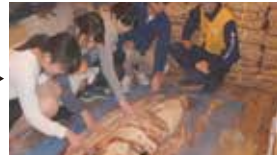
13:40 裏側見学+ダイオウイカにさわろう 約20分 @シーズー3F