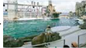
11:30 イルカ・アシカショー 約30分 @シーランド