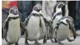
12:30 自由散策 約60分