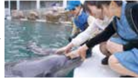
10:40 イルカのおへそはどこ？ 約20分 @シーランド