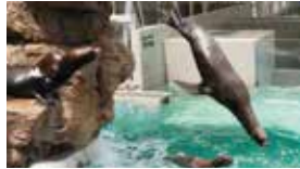
10:20 トドのダイビング 約7分 @チューブ