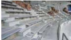
12:00 屋食（お弁当） 約30分 @シーランド